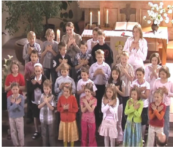
Erster Jahrgang der Drittklässler-Konfirmanden beim Abschlussgottesdienst

Wir bitten Sie um Unterstützung des Fördervereins durch eine einmalige oder regelmäßige Spende. Wir freuen uns, wenn Sie dazu auch Mitglied des Vereins werden, dies ist aber nicht zwingend nötig. Die Spen- den sind steuerlich abzugsfähig.